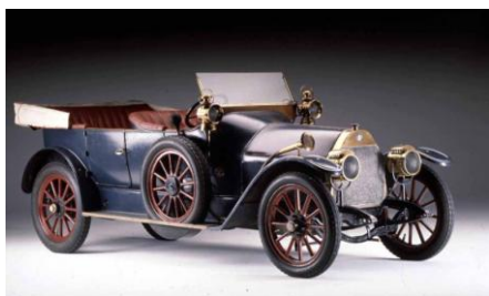
*) 24 HP - (1910) - Il primo gioiello