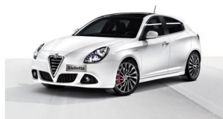
*) Giulietta - (2010) - Il Futuro

24 GIUGNO 1910 - 24 GIUGNO 2010 - UN SECOLO : RICORRENZA " STORICA " PER L'ALFA ROMEO