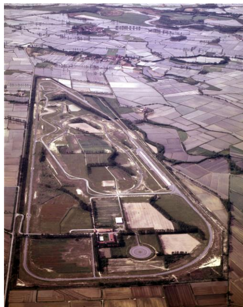
anni '60

N.d.R: Questo breve ricordo ci induce a considerare la possibilità, di una riedizione della visita alla pista sperimentale di Balocco nel prossimo anno